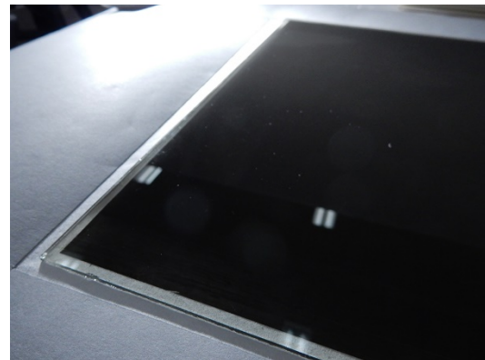
指紋等汚れ除去後